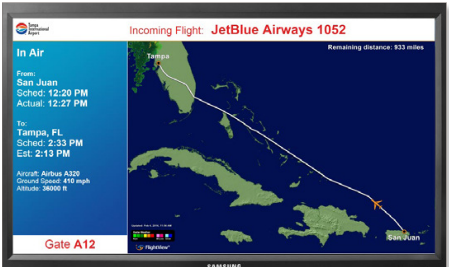
Pantallas de visión de vuelo